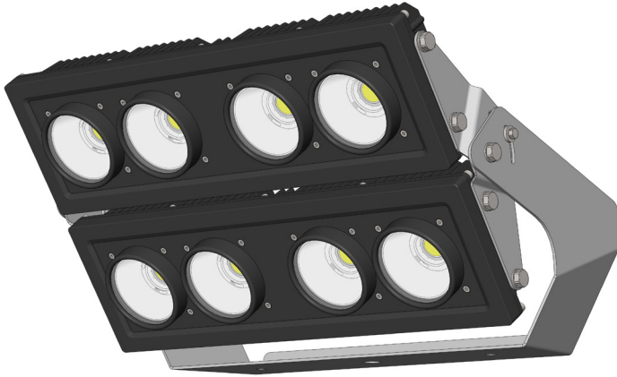
Abbildung zeigt Variante 29°- 88°