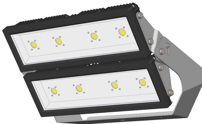
Abbildung zeigt Flächenstrahler FU