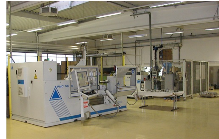
Hauseigene Leihfeld CNC-Drückmaschine